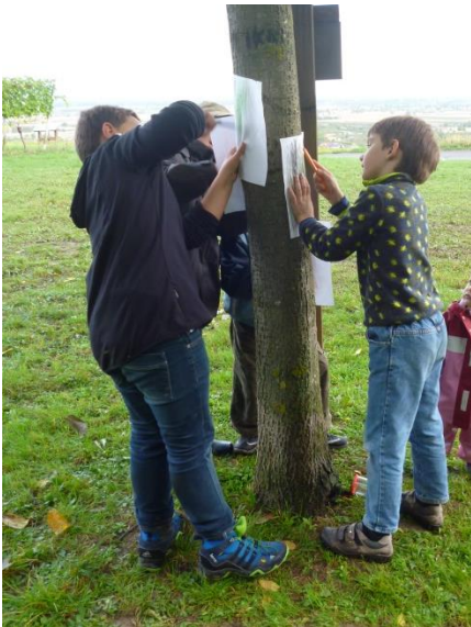
Viert- und Zweitklässler beim Erstellen einer Rindenfrottage.