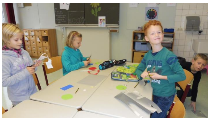
Beim Abschluss unseres Wald-Projektes in der Schule wurden Blättereulen gebastelt.