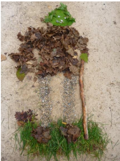
Bilder mit Waldmaterialien zu legen machte allen viel Spaß.