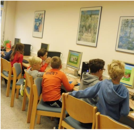
Im Computerraum gab es ein Wald-Quiz zu bearbeiten.