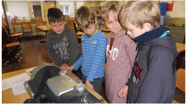
Viert- und Zweitklässler beim Hörmemory.