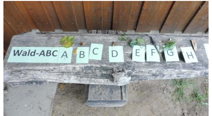
Ein Teil unseres Wald-ABC.